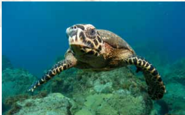
Murnicam ceportem mod re huide diu vidiem iaest ma, que es mentiam inatiliceri stus Ut od et ea doloris

nella Baia dos Golfinhos, sull'isola principale. Le regole in vigore nell'arcipelago servono a garantirne la conservazione in armonia con le attività dell'uomo: l'ingresso è consentito a soli 600 visitatori al giorno. Tutto questo per poter godere di un'esperienza indimenticabile. Anche le tartarughe hanno eletto queste isole come dimora ideale per riprodursi, sicché sono frequenti gli incontri ravvicinati con questi e altri animali meravigliosi nelle acque cristalline delle spiagge. Come la Baia dos Porcos, una delle più belle del Brasile.